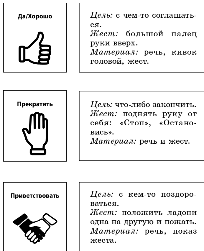
Рис. Пиктограммы, обозначающие различные действия

• Следует использовать ритмически организованную речь, виды занятий с использованием ритма (например, отхлопывание слова).